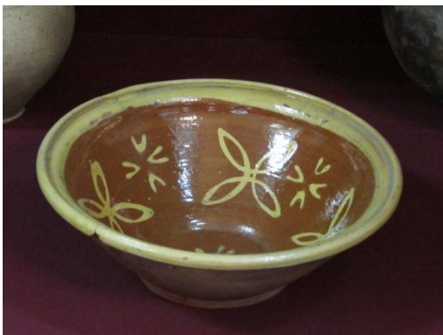
Рис. 1. Миска оздоблена в техніці «ріжкування». Слобожанщина. Глина, гончарний круг, ангоб, полива. Ост. Чверть ХІХ ст. (?) Експозиція Харківського історичного музею імені М. Сумцова

поступали на продаж, полив'яні «чашки» та «блюдця». Зображення наносилися і на значну кількість мисок і тарілок. Про малювання інших категорій виробів відомостей не збереглося. Зазвичай гончарі використовували спосіб, названий дослідниками ХХ ст. «ріжкуванням». Для цього використовувалися відомі на той час на значній території України інструменти – «ріжки» з обрізаного з двох боків рогу корови, в вужчий кінець якого встромлялася частина стрижня гусячої пір'їни («накосточок»). У кілька ріжків наливалися різнокольорові фарби (біла («побіл»), червоно-коричнева («вохра»), зелена «фабра» і жовта «циндра»). Виріб обертався на крузі. Гончар (його дружина чи діти) брали ріжок з однією фарбою в одну руку. І, розмістивши кінець накосточка над поверхнею виробу, «пускав» лінію. Якщо рука не ворушилася – утворювалася пряма концентрична смужка. Якщо рухалася у напрямках від-до гончаря, хвиляста лінія. Якщо ж рухи були іншими – утворювалися інші фігури й візерунки (мал. 1). Коли малювальник бажав зупинити витікання фарби з ріжка, закривав отвір у пір'їні пальцем тієї ж руки. Для зображення іншоколірних елементів він використовував ріжок з іншою фарбою [8, с. 33-36, 44-45, 57].