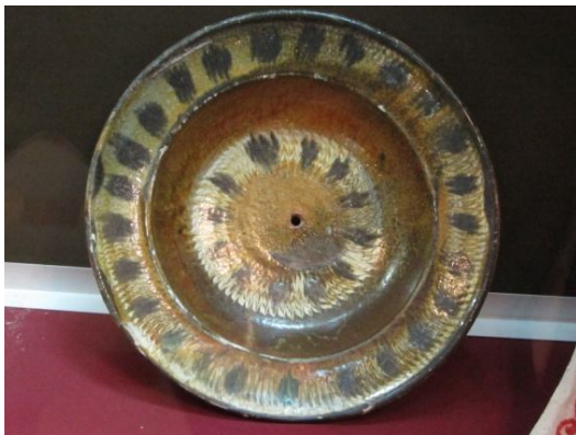
Рис. 2 Тарілка оздоблена «фляндрівкою». Леонтій Ткачев(?) Глина, гончарний круг, ангоб, полива. Сл. Гороховатка Купянського повіту(?), кін 1870 – початку 1880-х рр. Експозиція Харківського історичного музею імені М. Сумцова